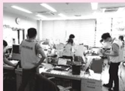
7月10日大雨・突風による被害 野木町災害VC運営にご協力いただきました。