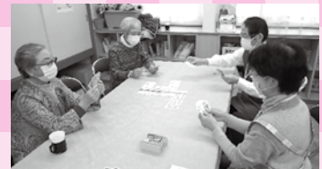
トランプ (サポーターと一緒に)