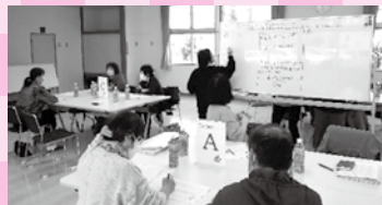
サロンサポーター会議の様子

応が難しい。」との意見もありました。それでもサポーターの皆さんは「筆談で対応するなど、参加者に寄り添った対応を心がけたい。」との意見も出て、積極的に参加者に関わっていく姿勢が感じられました。また、「お花見やクリスマス会など参加者がともに楽しめるイベントメニューはどうか。」という意見も出され、自分たちで創意工夫し、来てくれる方々に楽しい時間を過ごしてほしい。口コミで広がっていければ・・・との熱い思いが伝わる会議でした。