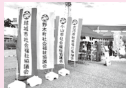
9月10日おやまゆうえんハーヴェストウォーク 防災フェスにて協働ブースを運営しました。