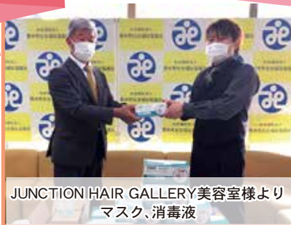
JUNCTION HAIR GALLERY美容室様より マスク、消毒液