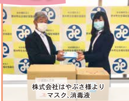
株式会社はやぶさ様より マスク、消毒液