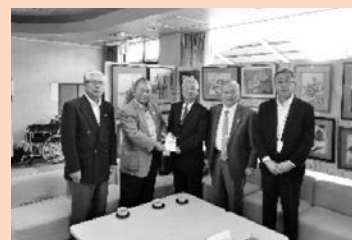
野木ライオンズクラブ 様