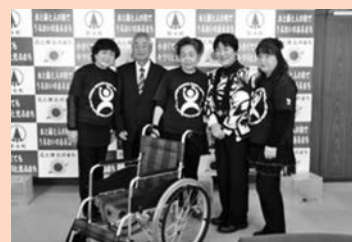
よさこい野木支部 様