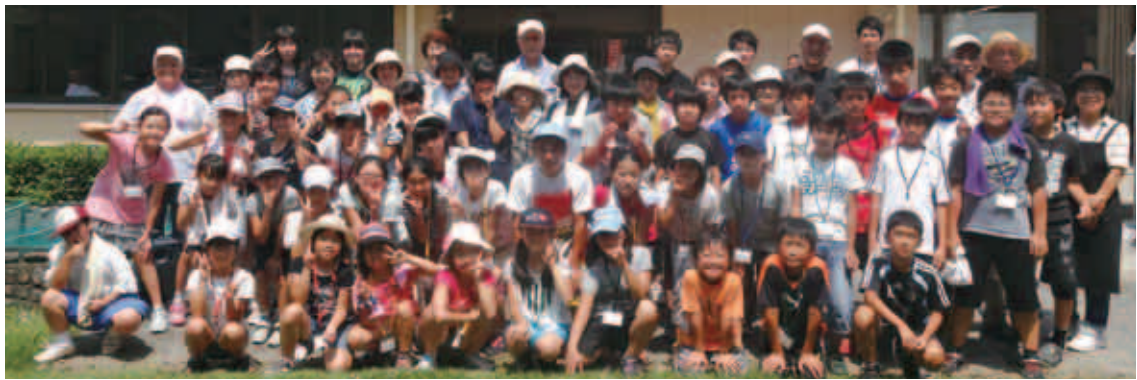
【災害ボランティア養成講座】