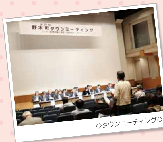
◇タウンミーティング◇