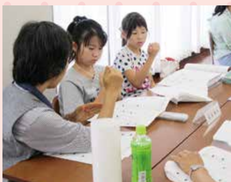
◇小学生チャレンジスクール◇