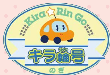
◇野木町デマンドタクシー「キラ輪号」◇