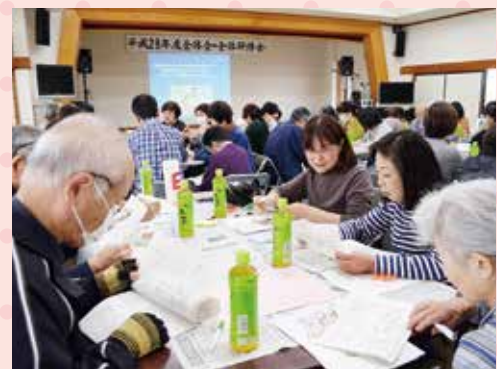
◇社会福祉ボランティア連絡協議会の全体会・全体研修会◇