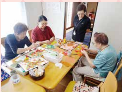
◇街かどカフェすまいる◇