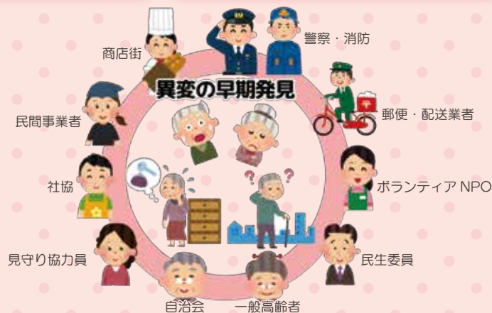
◇安全・安心見守りネットワーク事業 イメージ図◇